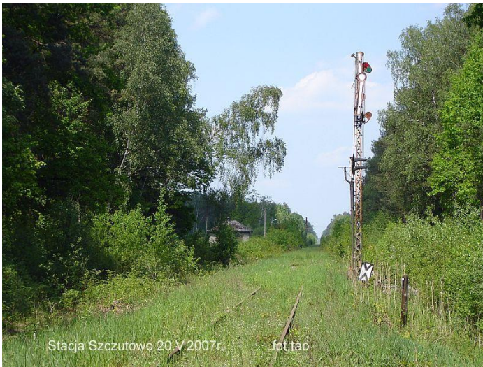
Foto wykonane dnia 20.05.2007 roku 7

Był to ostatni moment, który przesądził o losach stacji kolejowej w Szczutowie. Następuje jej dalsza degradacja i niszczenie.