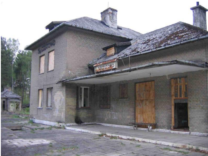
Autor: nieznany Przesłał: Marcin Kulinicz; data: 2005-05; Szczutowo – dworzec Foto pochodzi ze strony: https://www.bazakolejowa.pl/index.php?dzial=stacje&id=1064&okno=galeria2