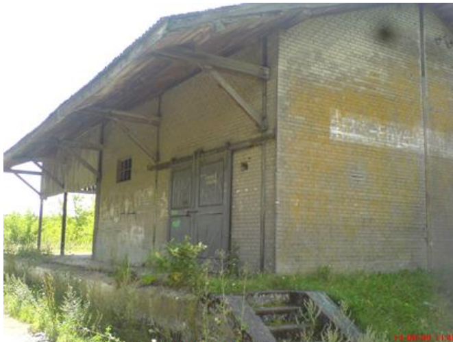
Stacja Szczutowo, rampa wyładowcza