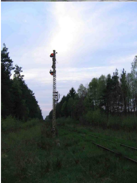
data: 2005-05; Szczutowo Zdjęcie po lewej Semafor wjazdowy od strony Rypina (Zdjęcie wykonano z drogi powiatowej Szczutowo – Czumsk) Zdjęcie po prawej Szczutowo - semafony wyjazdowe w stronę Rypina