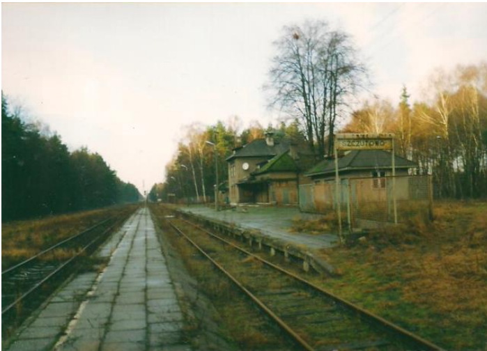
Ostatni pociąg w kierunku Brodnicy ze Szczutowa odjechał w dniu 2 kwietnia 2000 roku o godz. 21:15 5 .