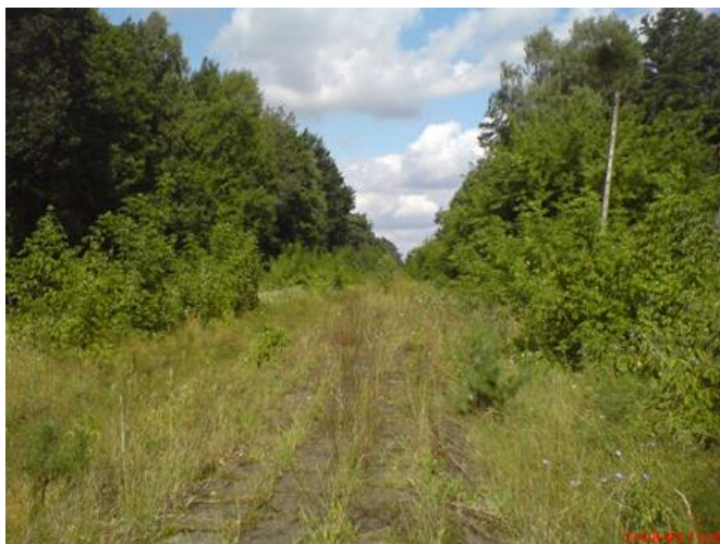
Stacja Szczutowo, tor do Sierpca