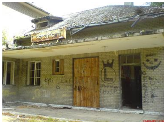
Stacja Szczutowo, widok od strony peronów. Pierwsze z prawej miejsce po drzwiach wejściowych na poczekalnię dla pasażerów dalej (zabite deskami) drzwi do pomieszczeń na przesyłki wielkogabarytowe.