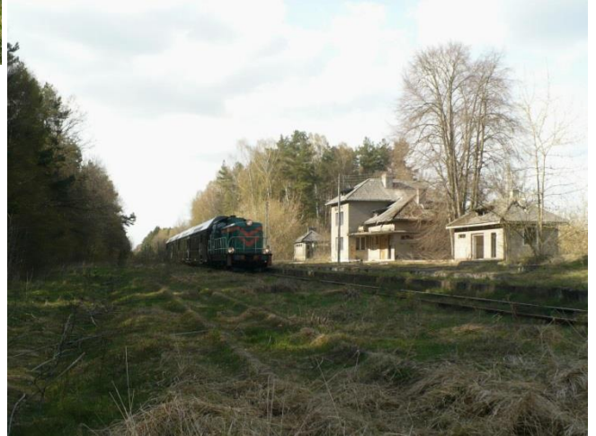
data: 2010-04-17; SM42-583 w Szczutowie "Wokół doliny Drwęcy", fotostop http://www.trakcja.one.pl/17.04.2010%20Chelmza-Sierpc/P1050886.JPG