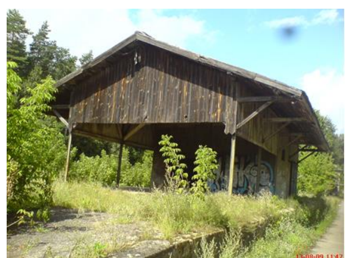
Stacja Szczutowo, rampa wyładownicza (widok z peronu od strony stacji kolejowej)