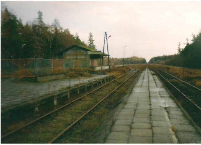
Widok ze Stacji Kolejowej w Szczutowie w kierunku Sierpca kilka dni po zamknięciu linii kolejowej dla transportu pasażerskiego 3