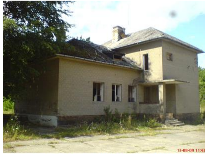
Stacja Szczutowo, widok od strony Szczutowa, 13.08.2009 r