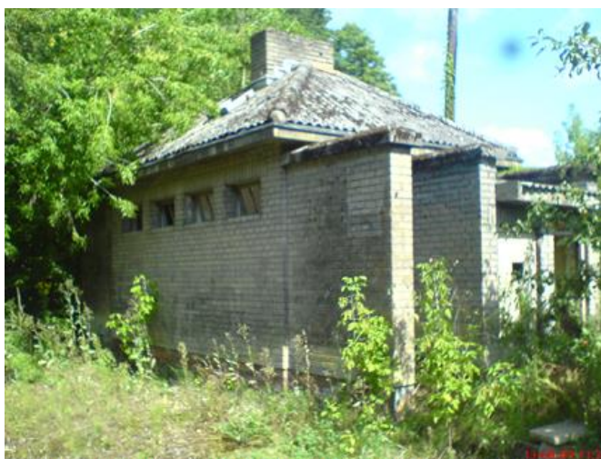
Stacja Szczutowo, przystacyjna „łazienka” . Widok od strony stacji. Wejście do części damskiej szaletu, z drugiej strony części męskiej.