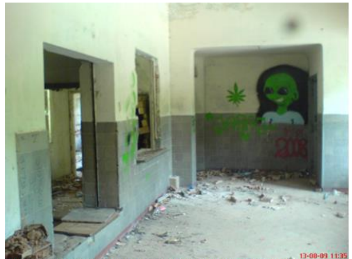
Wnętrze stacji Szczutowo, pierwszy otwór w ścianie w tym miejscu przyjmowano bagaż i przesyłki wielkogabarytowe. Dalej okienko kasy biletowej. W miejscu ufoludzika wisiał rozkład jazdy pociągów.