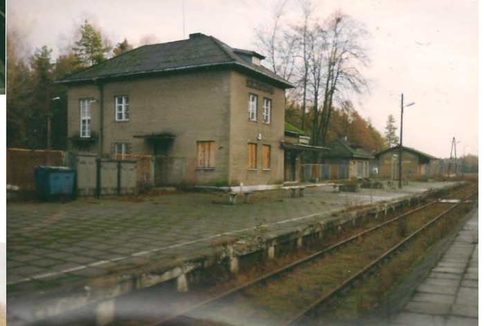
Budynek stacji pasażerskiej w Szczutowie w kilka dni po zamknięciu linii kolejowej dla transportu pasażerskiego 4 .