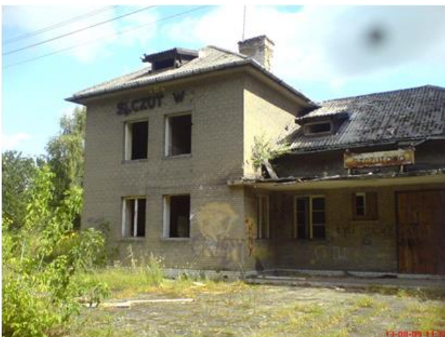
Stacja Szczutowo, widok od strony peronu, 13.08.2009 r.

http://www.sierpc.com.pl/galeria.php?start=1&kategoria=PKP++Szczutowo