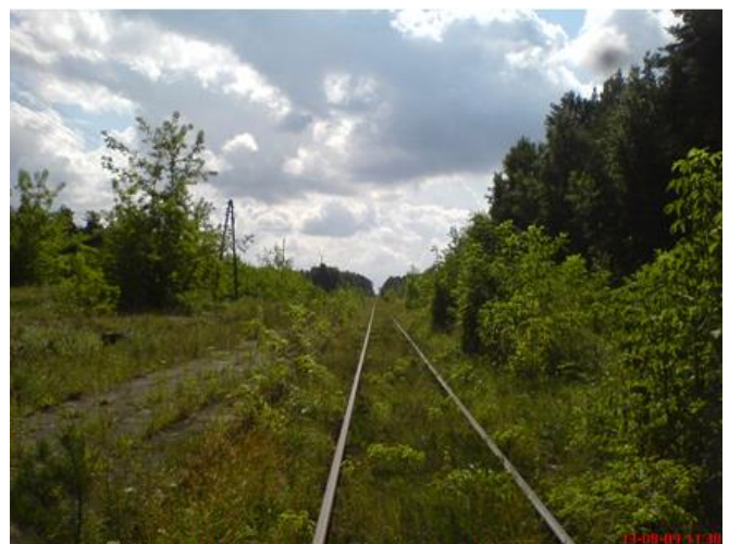
Stacja Szczutowo, tor do Brodnicy

17 kwietnia 2010 roku Stowarzyszenie Sympatyków Komunikacji Szynowej przy współpracy z Kujawsko-Pomorskim Zakładem Przewozów Regionalnych oraz PKP Polskie Linie Kolejowe S.A. zorganizowało przejazd pociągiem specjalnym pod nazwą „Wokół Doliny Drwęcy”. Trasa przejazdu wiodła przez zapomniane przez pociągi pasażerskie szlaki w regionie kujawsko-pomorskim. Skład złożony z lokomotywy spalinowej SM42-583 oraz czterocłonowego składu Bhp w czarnym malowaniu, z ponad dwustoma uczestnikami wyruszył z Torunia Głównego do Chełmży o godzinie 9.44. (...)