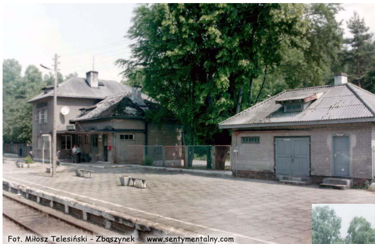
Fot. Miłosz Telesiński - Zbąszynek www.sentymentalny.com

Stacja PKP w Szczutowie. Foto wżkonane dnia 11.06.1998 przez Miłosza Telesińskiego Opublikowane na stronie: http://sentymentalny.com/?page_id=281