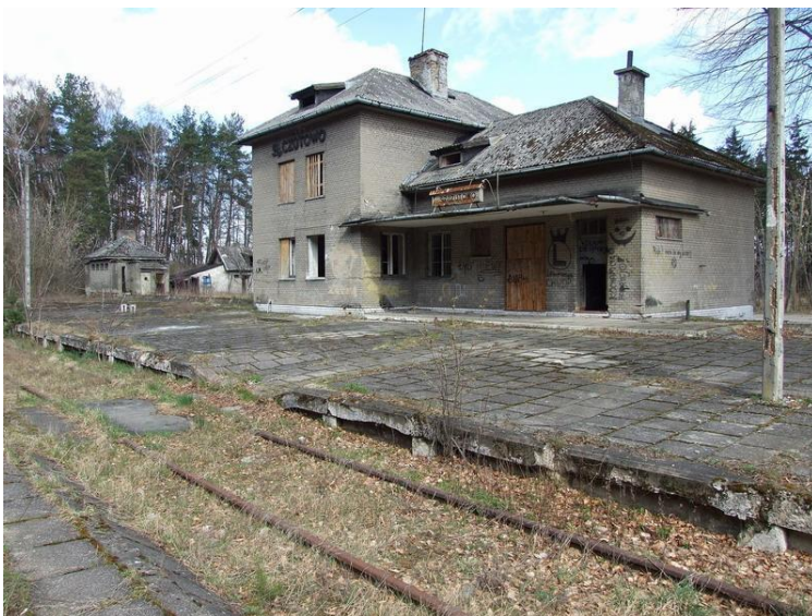
Widok na budynek stacji Szczutowo. Zdjęcie wykonano 10 lutego 2007r.