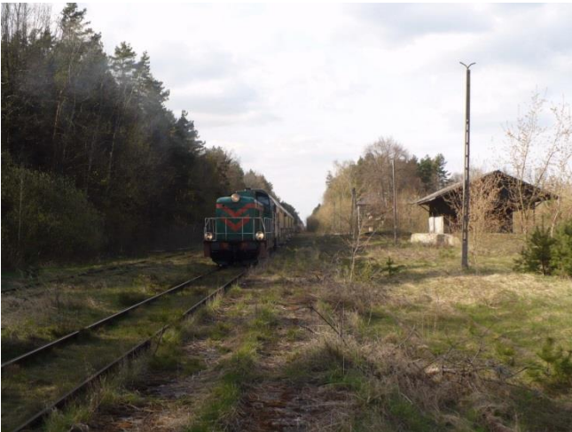
data: 2010-04-17; SM42-583 w Szczutowie "Wokół doliny Drwęcy"

W dniu 9 sierpnia 2012 roku PKP S.A. Oddział Gospodarowania Nieruchomościami w Warszawie, ul. Armatnia 14, 01-246 Warszawa ogłasza przetarg nieograniczony na „Rozbiórkę budynku dworca z obiektami towarzyszącymi oraz budynku gospodarczego”.