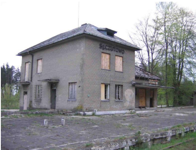
data: 2005-05; Szczutowo – dworzec