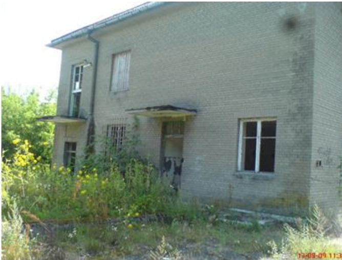
Stacja Szczutowo, widok od strony peronów. Na pierwszym planie okno i drzwi wejściowe do pomieszczeń służbowych stacji dalej wejście do mieszkania służbowego zawiadowcy stacji.