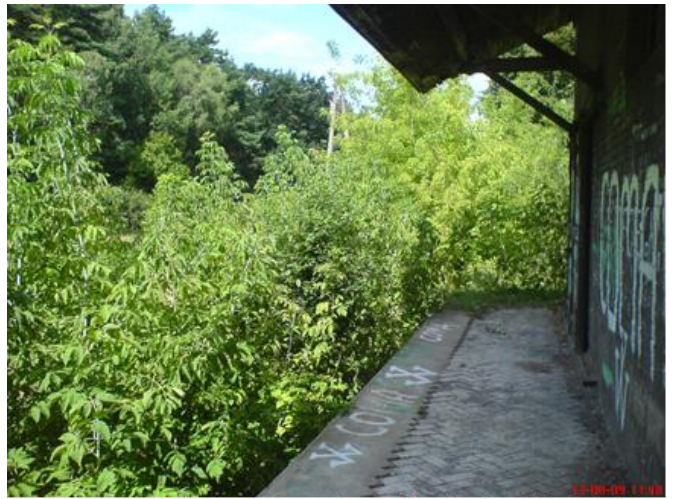
Stacja Szczutowo, rampa wyładowcza. (za tymi krzakami znajdują się kolejno budynek nastawni i dalej Stacji kolejowej)