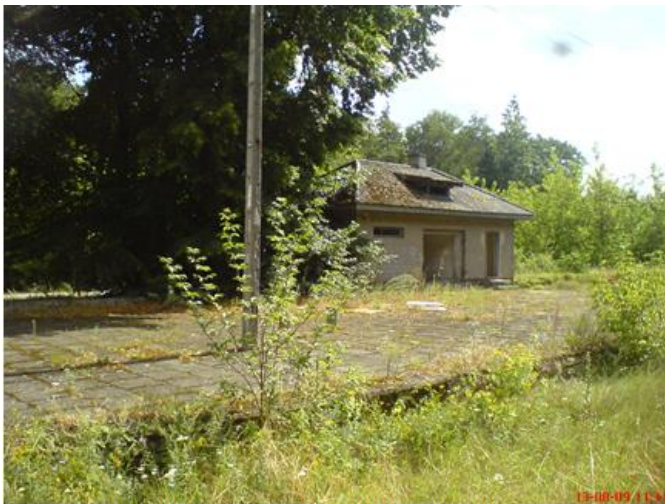
Nastawnia Szczutowo, Widok od strony peronów