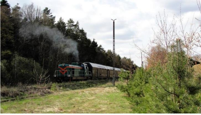
data: 2010-04-17; SM42-583 w Szczutowie "Wokół doliny Drwęcy"